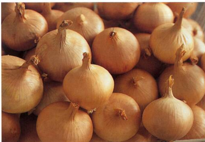
Die Speisezwiebel 'ZEFA Wädenswil' hält sich am Naturlager sehr lange. Les oignons 'ZEFA Wädenswil' se conservent longtemps en condition de stockage naturel.

Bearbeitet von der Eidgenössischen Forschungsanstalt Wädenswil (Hp. Buser). Mai 1994